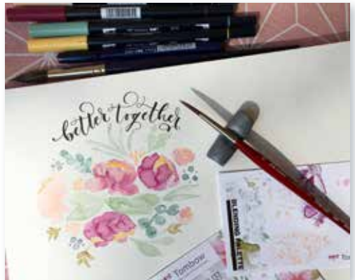
Lettering und Illustration. Bild: Melanie Robinet