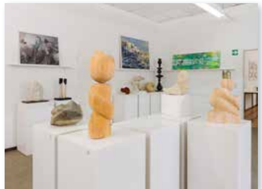
Bildhauerei in den VHS-Kunstwerkstätten, Foto: Volker Kunkel