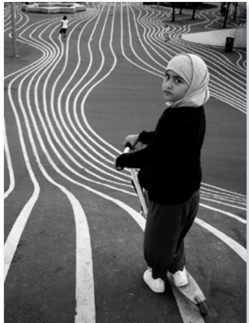
Street Photography.