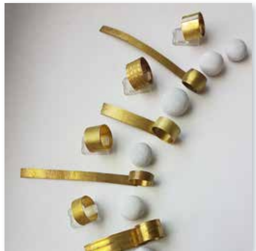
Ringe Goldschmieden

Sich inspirieren lassen, einer Idee auf die Spur kommen... Mit Zange, Säge und Feile bearbeiten Sie den Werkstoff Metall und lassen ein Schmuckstück entstehen. Auch das Prägen von Mustern mit der Walze ist möglich. Unter fachkundiger Anleitung erobern Sie sich Schritt für Schritt grundlegende Techniken dieses alten Kunsthandwerks. In der anregenden Atmosphäre einer gut ausgestatteten Goldschmiede wartet ein umfangreicher Materialfundus auf Sie, der zu vielfältigen Gestaltungsmöglichkeiten anregt. Es wird mit Silber, Messing oder Kupfer gearbeitet. Das Arbeiten mit Gold ist ggf. nach vorheriger Rücksprache mit der Dozentin möglich (Bitte kontaktieren Sie uns.). Gold muss mindestens zwei Wochen vor Kursbeginn bestellt werden. Teile mitgebrachter alter Schmuckstücke können unter Umständen integriert werden. Voraussetzungen: Für Anfänger und Fortgeschrittene. Bitte mitbringen: Gute Sehhilfe oder Lupe falls erforderlich. Geld für das Material (z. B. Silber für einen Ring ca. 10-30 €, Edelstein mit Silberfassung ab 8 €).