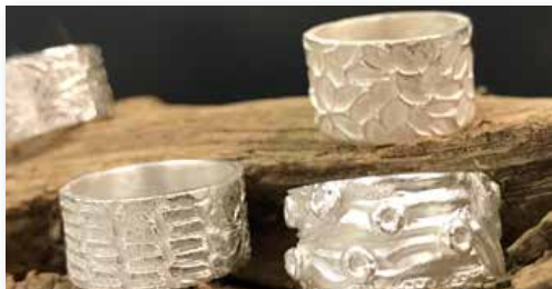
Ringe aus Silver Clay.

So 18. Juni 2023, 10:00 - 17:00 Uhr VHS-Kunstwerkstätten; Brookweg 28; Malersaal 9 Ustd., 7 Plätze, 116 € (inkl. Materialkosten, Werkzeugleihe und Brennen 35 €). Keine Ermäßigung möglich. Das Material reicht i. d. R. für ein Schmuckstück. Weiteres Material kann auf Wunsch direkt im Kurs erworben werden. Kursnummer 23AO 41446