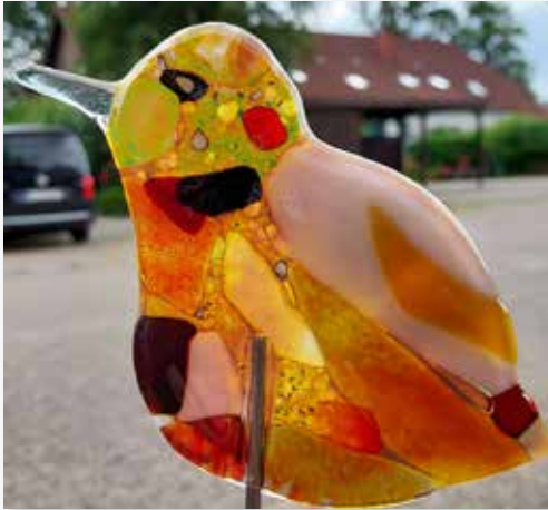
Fabeltier aus Glas

gemeinschaftlich durchgeführten Gasbrandverfahren ihr individuelles Dekor das sich durch seine besondere Ober- fläche auszeichnet. Voraussetzungen: Für Anfänger und Fortgeschrittene. Bedingt für Asthmatiker geeignet. Bitte mitbringen: Unempfindliche Kleidung, feste Schuhe. Ma- terialkosten fallen an.