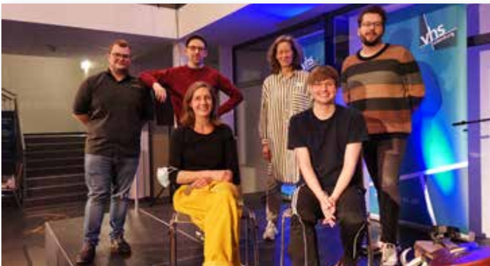
Poetryslam im November 2021