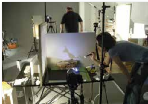
Objektfotografie und Beleuchtung