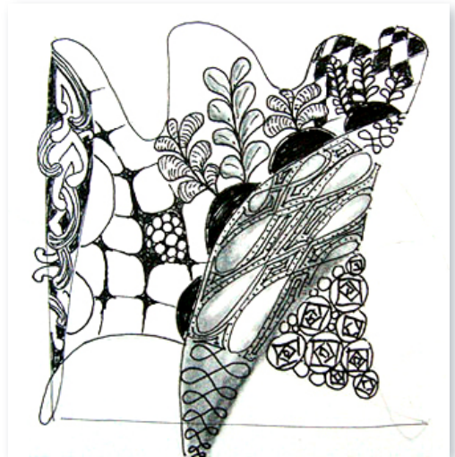
Zendoodle, Susanne Krause