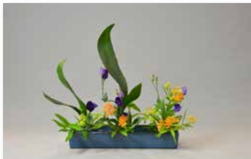
Ikebana-Arrangement von C. Hamer