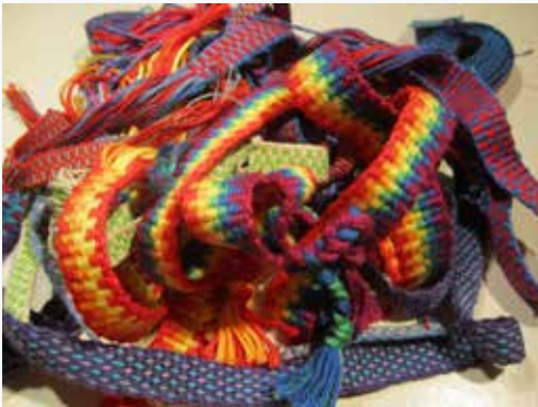
Bandweben, Bild: Katharina Klee