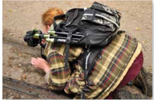
Kursteilnehmerin nimmt Motiv ins Visier

Sa 10. Sept. 2022, 11:00 - 16:15 Uhr VHS, Karlstraße 25, Oldenburg; Raum 4.13 7 Ustd., 50 € Keine Ermäßigung möglich. Kursnummer 22BO 41727