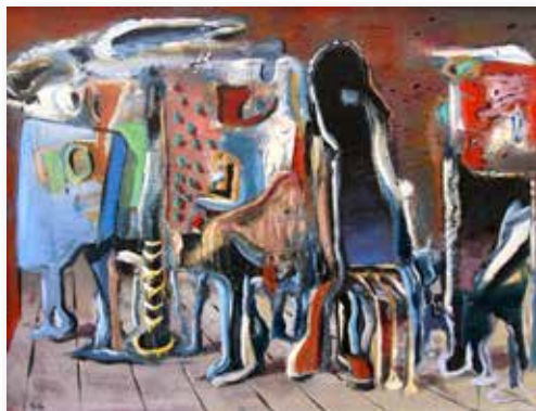
Seltsame Dinge, Acryl auf Leinwand, Bild: Theo Haasche