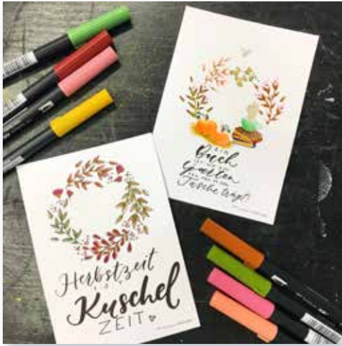
Lettering und Illustration, Bild: Melanie Robinet