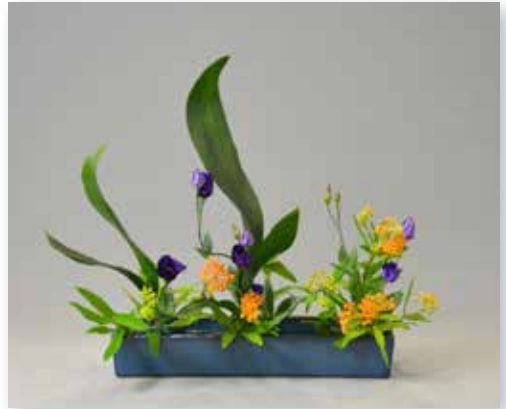
Ikebana-Arrangement von C. Hamer