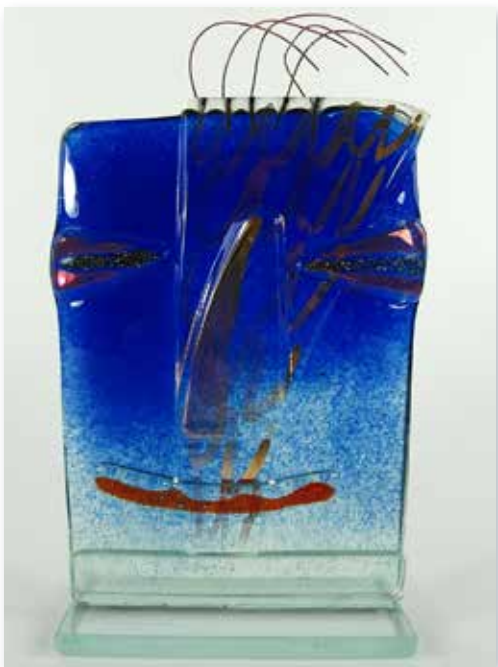
3D Glasskulptur-Kof-blau