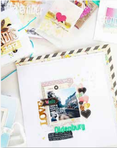
Kreativtechniken, Bild Janna Werner