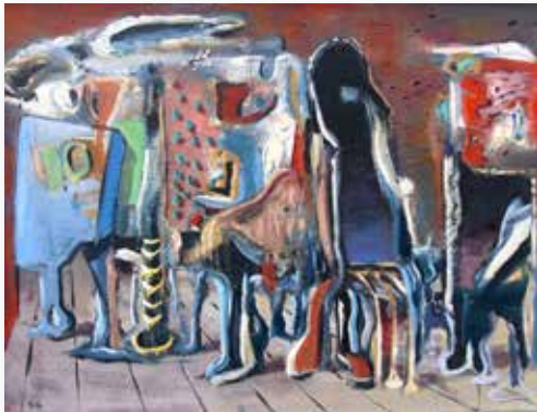
Theo Haasche, Seltsame Dinge_Acryl auf Leinwand