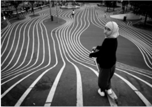
Street Fotografie