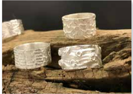
Ringe aus Silver Clay, Bild: Dana Kleinschmid

Wochenende 15. / 16. März 2024 Fr 16:00 - 20:00 Uhr, Sa 11:00 - 17:30 Uhr Atelier bluebox; Lindenstr. 18; 26123 Oldenburg 14 Ustd., 199 € (zzgl. Materialkosten je nach Verbrauch) Keine Ermäßigung möglich. Anmeldeschluss: 7. März 2024 Kursnummer 24AO 41443