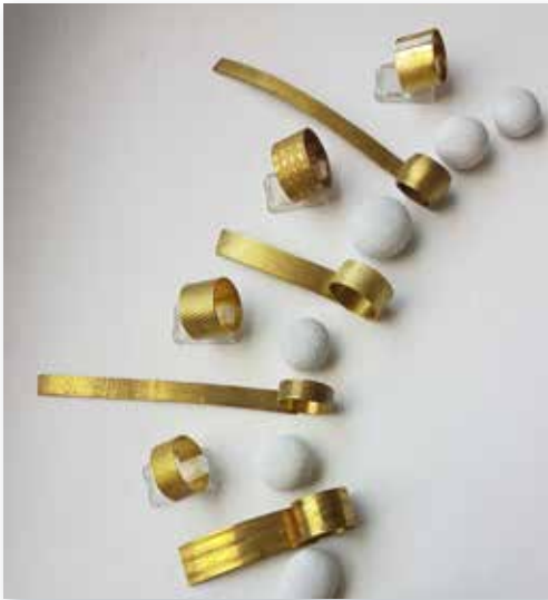
Ringe Goldschmieden

So 16. Juni 2024, 10:00 - 17:00 Uhr VHS-Kunstwerkstätten; Brookweg 28; Malersaal 9 Ustd., 124 € (inkl. Materialkosten, Werkzeugleihe und Brennen 40 €). Keine Ermäßigung möglich. Das Material reicht i. d. R. für ein Schmuckstück. Weiteres Material kann auf Wunsch direkt im Kurs erworben werden. Kursnummer 24AO 41446