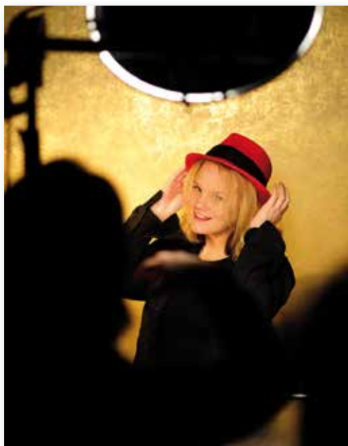
Porträtworkshop im Fotostudio