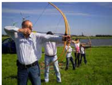
Bogenschießen, Foto: Horst Ukena