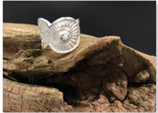
Ring aus Silver Clay