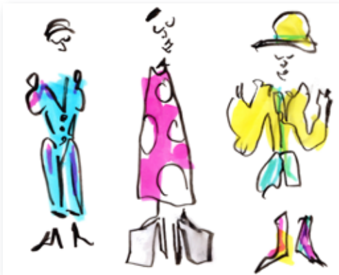
Zeichnen: Figur, Mode, Kostüm.

Do 19:30 - 21:00 Uhr, ab 11. Jan. 2024 VHS-Kunstwerkstätten; Brookweg 28; Malersaal 3-mal (6 Ustd.), 65 € (inkl. Modellkosten) Kursnummer 23BO 41308