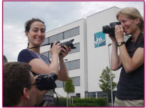
Kursteilnehmer der VHS Oldenburg

Sa 2. Juni 2018, 10:00 - 17:00 Uhr VHS, Karlstraße 25, Oldenburg; Raum 4.13 8 Ustd., 11 Plätze, 56 € (inkl. Kopierkosten und Fototechnik 5 €) Kursnummer 18AO 41708