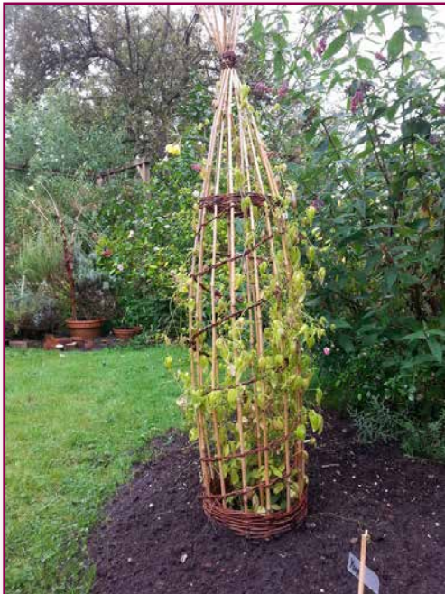
Gunda Albers: Rankhilfe

So 27. Mai 2018, 10:00 - 18:45 Uhr VHS-Kunstwerkstätten; Brookweg 28; Malersaal 11 Ustd., 10 Plätze, 66 € (inkl. Materialkosten 9 €) Anmeldeschluss: 8. Mai 2018 Kursnummer 18AO 41544