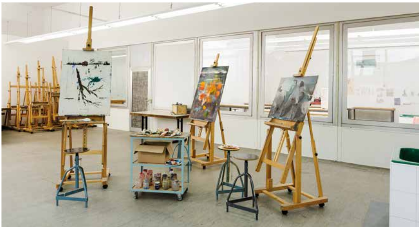
Malersaal der VHS-Kunstwerkstätten

Die VHS-Kunstwerkstätten befinden sich am Brookweg 28 . Hier finden Sie den Malersaal, die Holzwerkstatt, die Steinbildhauerei und die Keramikwerkstatt. Die Kunstwerkstätten sind barrierefrei.