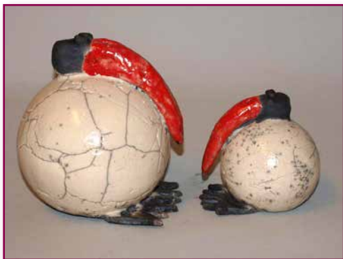
Rakuobjekte von Anke Otto